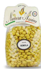
Gnocchetti di Semola