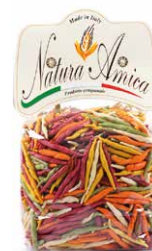
Trofie 5 Sapori