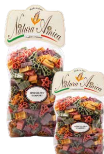
Stelle di Natale