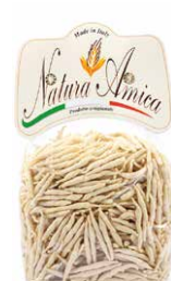
Trofie di Semola