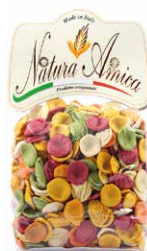
Orecchiette ai 5 Sapori