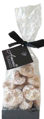
Amaretti Amaretti Limone