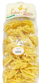
Tagliolini all'Uovo Nidi (Nest)