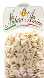
Orecchiette di Semola