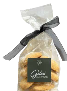
Golosi al Limone Golosi al Gianduja