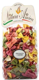
Farfalle 5 Sapori