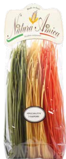
Linguine 3 Sapori