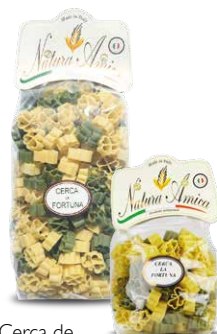
Cerca de la Fortuna Bianco | Verde