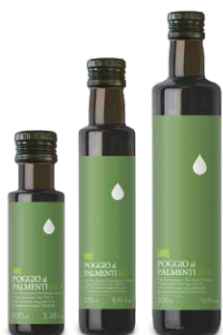
Poggio ai Palmenti extra vergine biologico Italiano