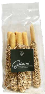
Grissini Cioccolato Fondente