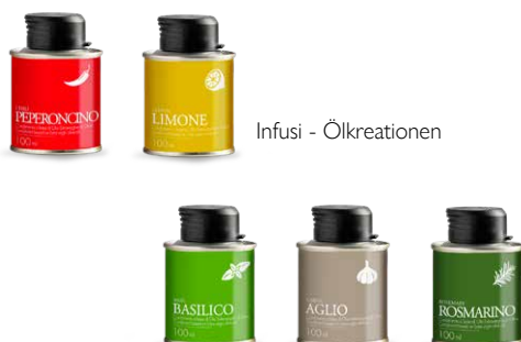
Infusi - Ölkreationen