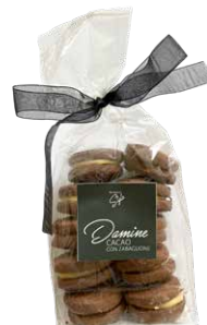
Damine Cacao con Zabaglione