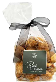
Baci di Dama alla Nocciola