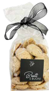
Brutti e Buoni