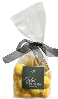
Baci di Dama al Limone