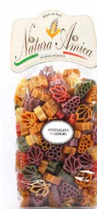
Pasta Uva ai 5 Sapori